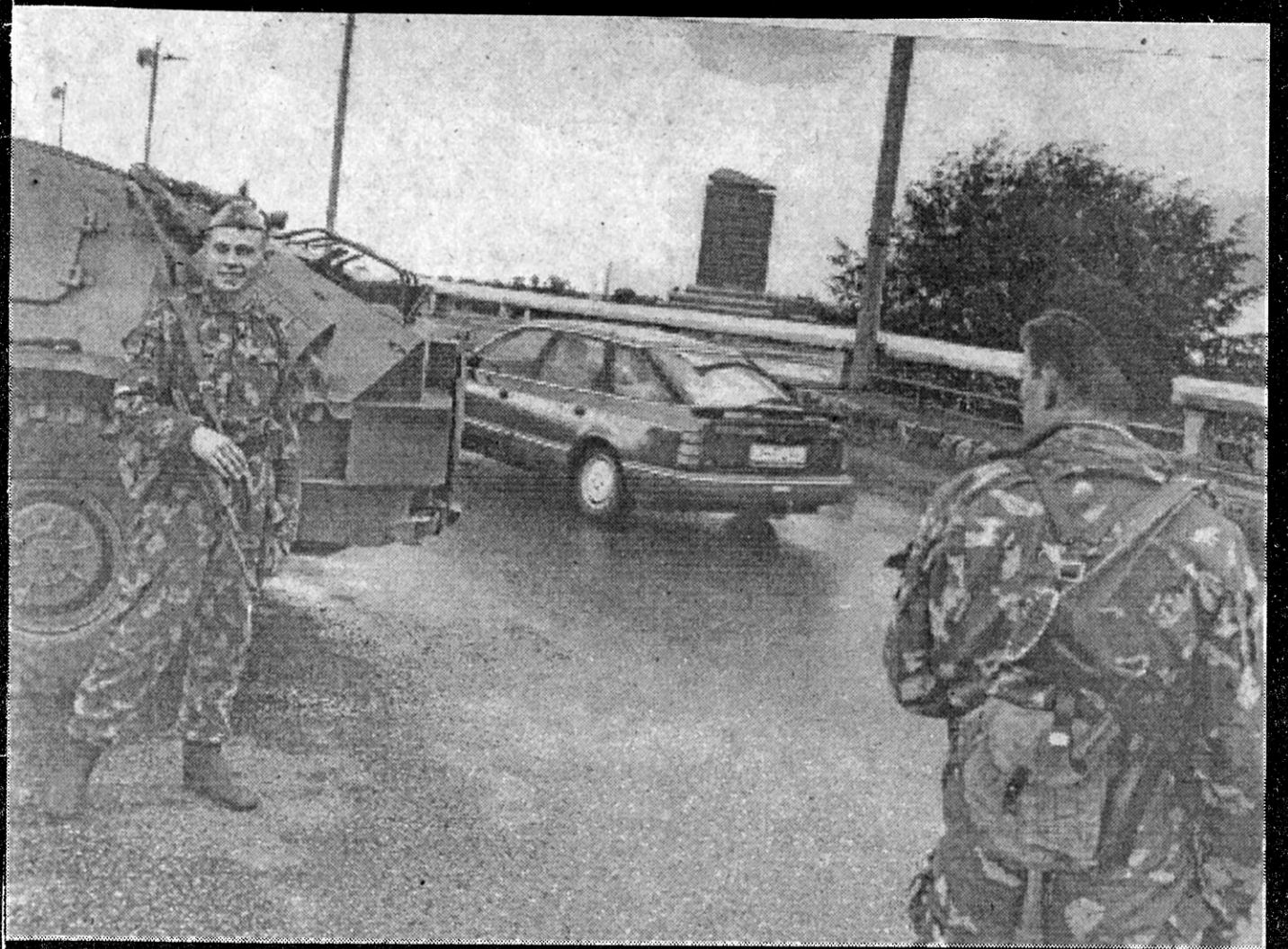
Armija bloķē Salu tiltu, 19.augusts.