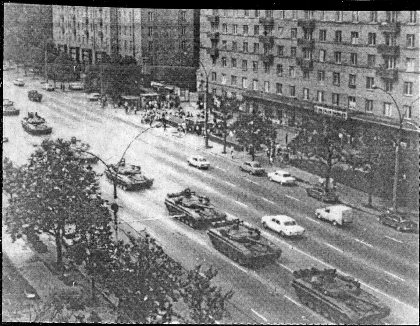
Tanki ierodas Maskavā 19.augustā.