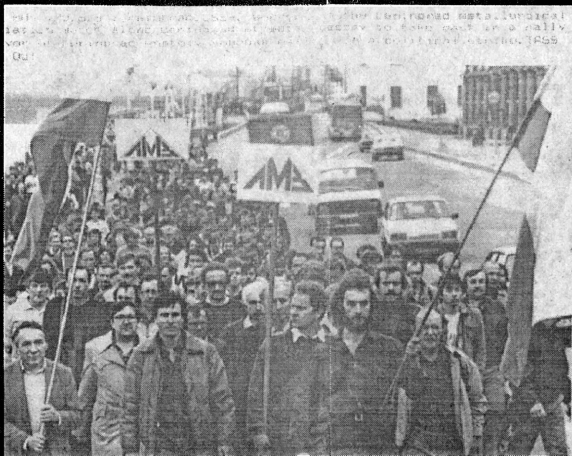
Streikam pievienojās arī Ļeņingradas strādnieki.