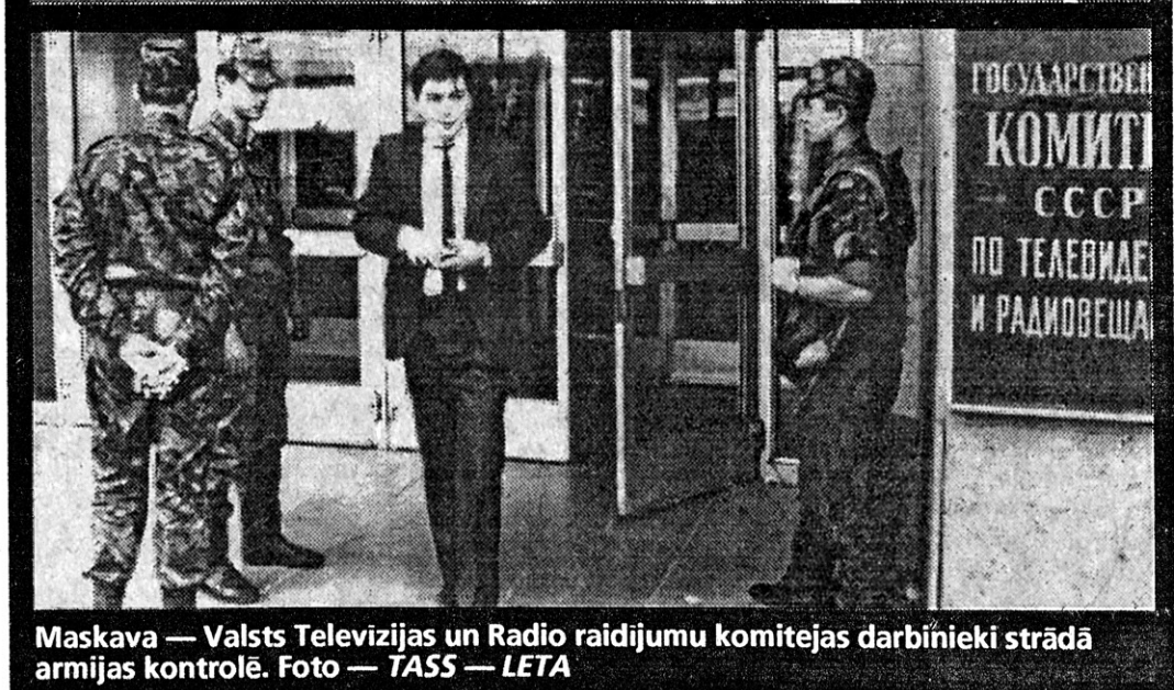
Maskava — Valsts Televīzijas un Radio raidījumu komitejas darbinieki strādā armijas kontrolē.