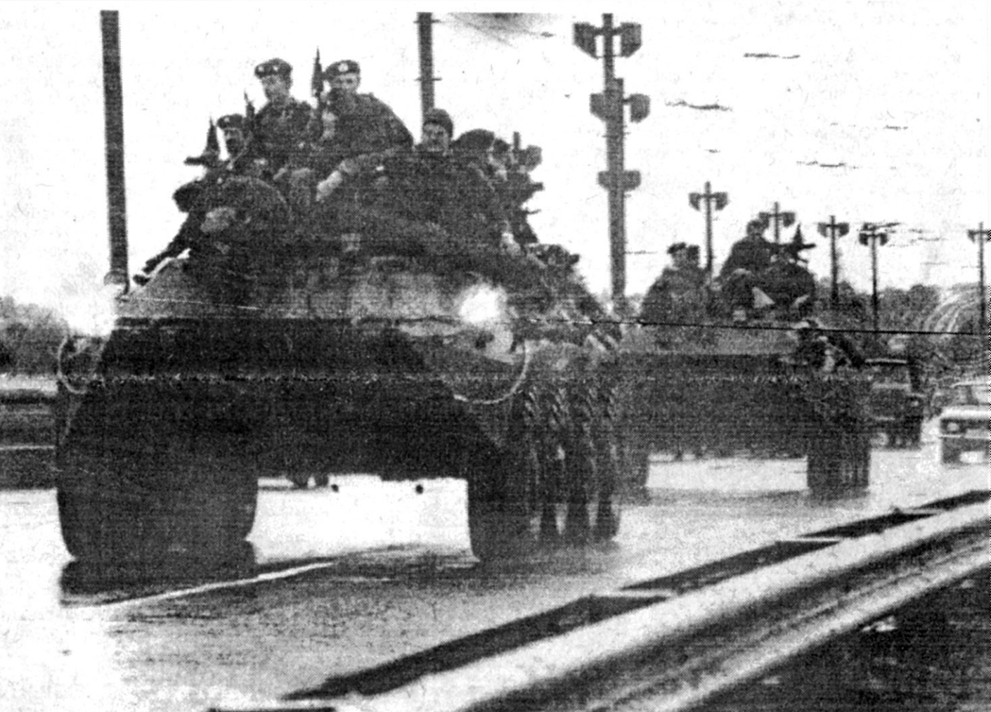
19. aug. Pēc televīzijas ieņemšanas.

jiem, kurā attaisnota ārkārtējā stāvokļa ieviešana mūsu republikā un aicināts saglabāt mieru un savaldību. To parakstījušas dažādas komunistiskas ievirzes organizācijas un partijas, sākot no LKP CK un Interfronks, beidzot ar AP frakciju Lidztiesību. Šīs frakcijas vadītājs S. Dimanis, paraudzīdamies uz vienu no uzsaukuma eksemplāriem, parautstīja plecus un Dienai pavēstīja: «Neko tamlīdzīgu es parakstījis neesmu un redzu to pirmo reizi.» Jāatgādināts, ka vienā no Lidztiesības AP lēmuma projektiem šī frakcija apvērsuma Maskavā ir novērtējusi kā nelikumīgu. ♦