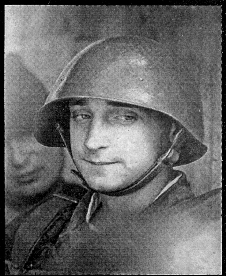
Rīgas Radio sardzē desanta karaspēks.