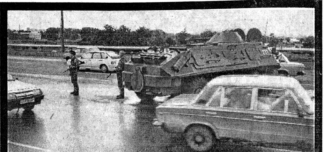
Salu tilts — tāpat kā lielākā daļa Rīgas stratēģisko objektu — armijas kontrolē.