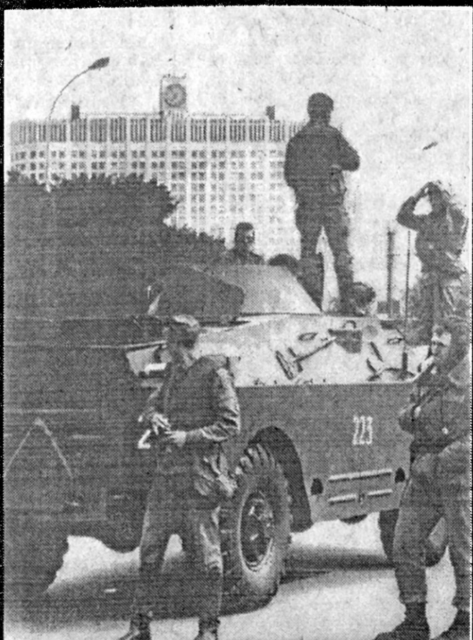
Jelcina armija KPFSR valdības sardzē.